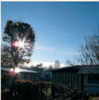
Bilder: Impressionen vom Campingplatz beim Fischer