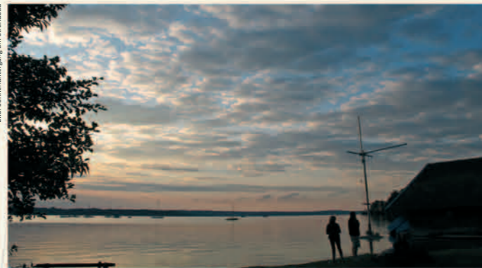
Bild: Sommererregung am Strandbad

Erfrischen Sie sich am Kiosk des Strandbads oder stärken Sie sich im Biergarten mit einer zünftigen Brotzeit.